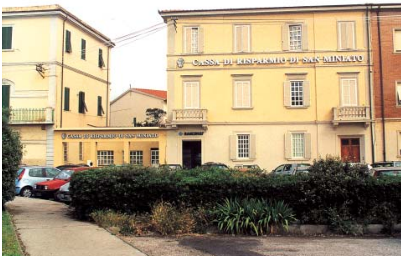
Filiale di Livorno2