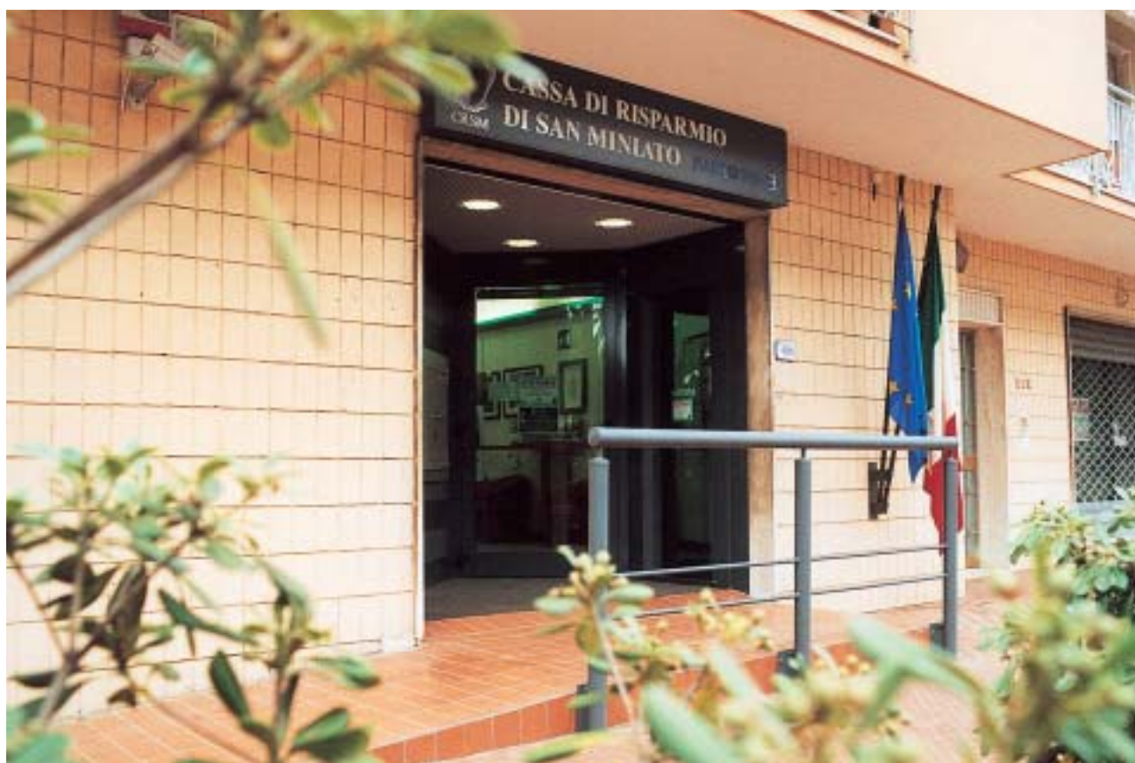
Filiale di Castiglioncello